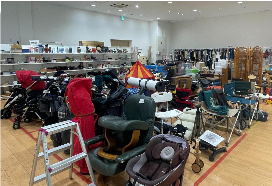
ジモティースポットの様子 (写真はジモティースポット千葉稲毛店)