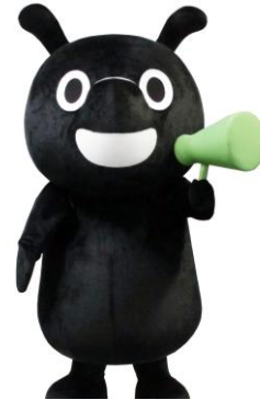
千葉市のごみ削減キャラクター「へらそうくん」 ジモティー公式キャラクター「ジモティーくん」