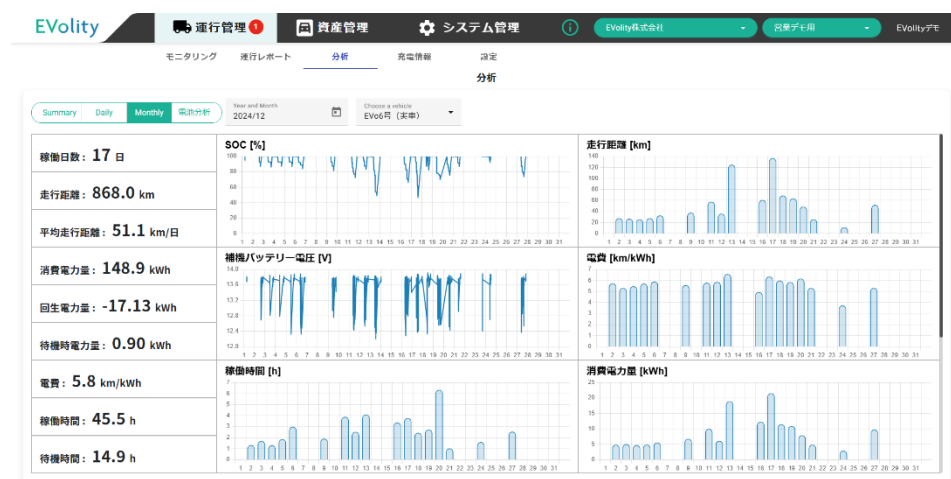
＜フリートマネジメントシステム（月次分析の画面）＞