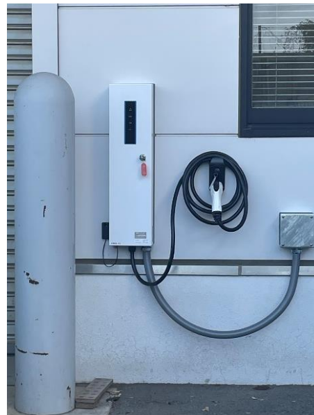
＜導入される EV 車両（フォロフライ F1VS 4 シーター と充電設備＞