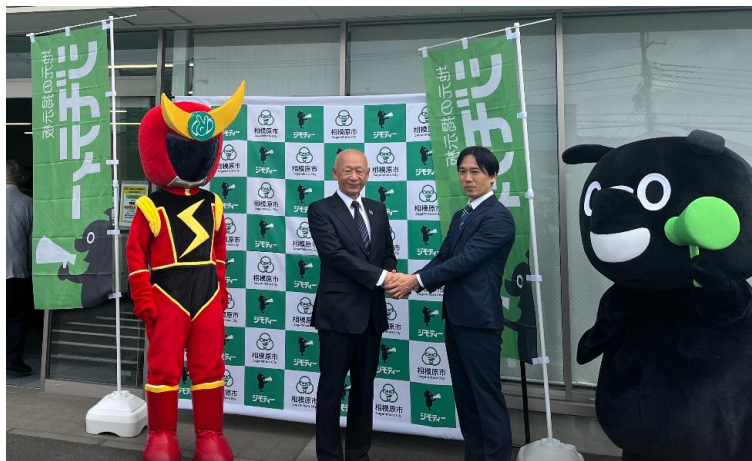
オープニングセレモニーの様子