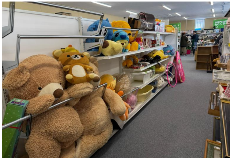
「ジモティースポット相模原」店内の様子

プレオープンから 2025 年 4 月 16 日までの間に 4,484 品の不要品が持ち込まれ（注 2）、1,721 品が既にリユースされています。ごみの減量効果は、約 6,272kg と試算しております（注 1）。期間中、最も多く持ち込まれたのは、食器類で全体の約 29%、次いで家具・家電が全体の約 17%でした。これまでごみとして廃棄されていたような古い家具や家電製品などであっても、ジモティーの集客力を活かし、回収後すぐにサイト上でリユース品の情報を掲載することで、多くの方にリユース品（1,721 品）を提供することができました。