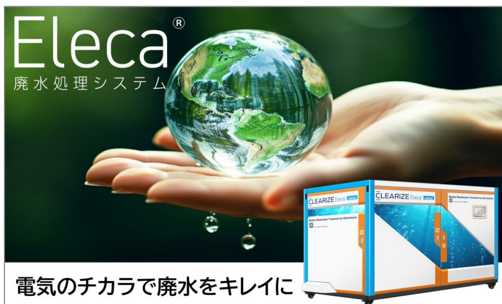
廃水処理システム Eleca mini 外観