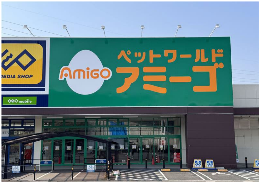
【ペットワールドアミーゴ光ケ丘店外観】