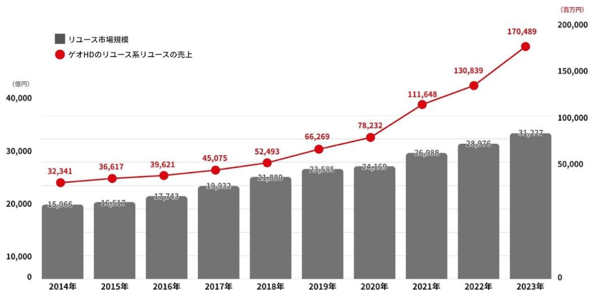
リユース市場規模とゲオHDのリユース系リユースの売上推移