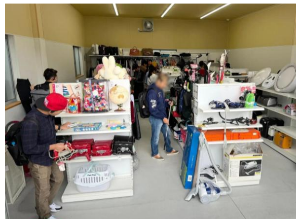
ジモティースポットの様子(写真はジモティースポット名古屋上小田井店)