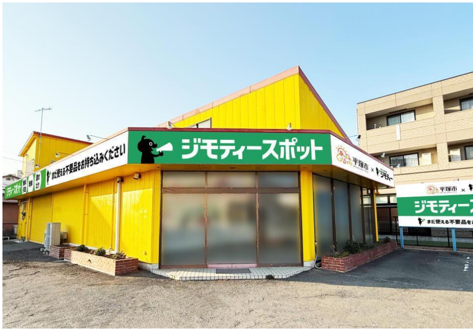
ジモティースポット平塚の店舗外観

・開催日時：2025 年 4 月 25 日（土）9 時 30 分～10 時 00 分