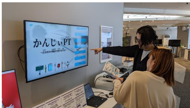
「5G X LAB OSAKA」内に新たに設置された生成 AI コーナー③