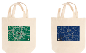
路線図トートバッグ 各1,800円