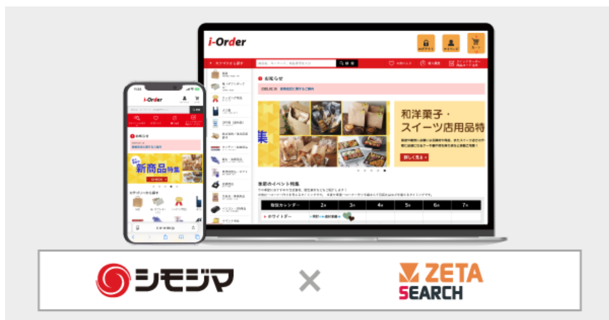
【シモジマの BtoB 受注システム『i-Order』】

EC 商品検索・ハッシュタグ・ロイヤルティ向上ソリューション・リテールメディア広告・EC キュレーションを開発販売するコマースと CX のリーディングカンパニーである ZETA 株式会社(本社：東京都世田谷区、以下 ZETA)は、株式会社シモジマ(本社：東京都台東区、以下シモジマ)の BtoB 受注システム『i-Order』にて EC 商品検索・サイト内検索エンジン「ZETA SEARCH」が導入されたことをお知らせいたします。