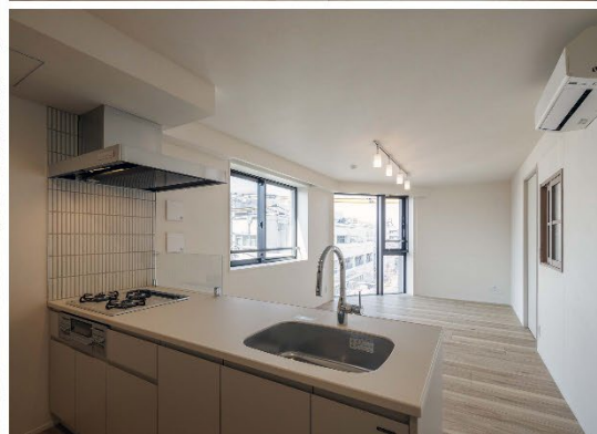
【『GranDuo 祖師谷 6』外観・内観】

本物件は、小田急小田原線「祖師ヶ谷大蔵」駅から徒歩 7 分、住宅街と自然が調和した落ち着いたエリアに位置しています。「新宿」駅に直通という優れたアクセスに加え、駅周辺には約 700 店を超える飲食店やスーパーが並ぶウルトラマン商店街が広がり、日常生活に便利な環境が整っています。