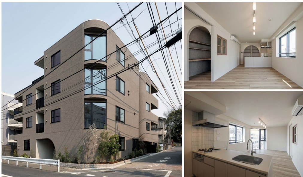
【GranDuo 祖師谷 6 外観・内観】

当社は、東京都世田谷区砧に、敷地の特徴を活かした開放感のある自社開発物件「GranDuo（グランデュオ）祖師谷 6」が完成したことをお知らせいたします。