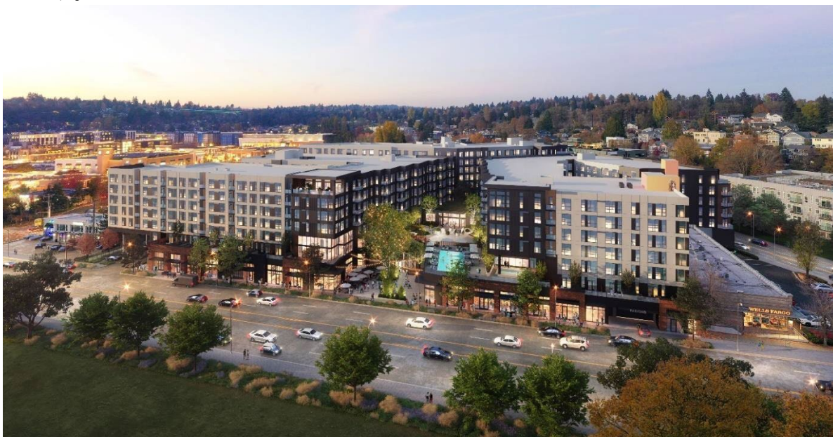
本物件の完成予想パース

本案件への取り組みを通じて、ノウハウや知見を蓄積し、米国における海外事業の拡大を目指してまいります。