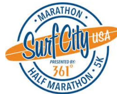
サーフシティマラソンUSA