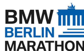
ベルリンマラソン