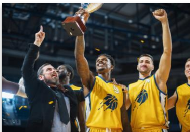
プロチームスポンサー