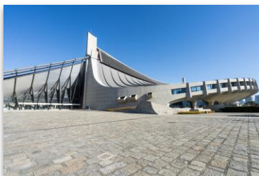
施設ネーミングライツ