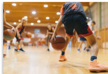
学生スポーツ協賛