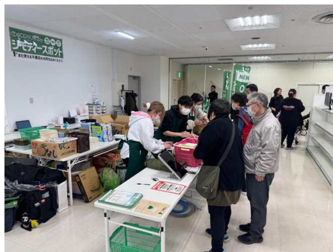
たくさんの不要品が持ち込まれる様子

店舗開設から1ヶ月で7,749品の不要品が持ち込まれ（注2）、2025年2月16日時点で4,675品が既にリユースされています。ごみの減量効果は、約9,300kgと試算しております。期間中、最も多く持ち込まれたのは、食器・生活雑貨類で全体の約42%、次いで衣類が全体の約17%でした。これまでごみとして廃棄されていたような古い家具や家電製品などであっても、ジモティーの集客力を活かし、回収後すぐにサイト上でリユース品の情報を掲載することで、多くの方にリユース品（4,675品）を提供することができました。