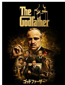
『ゴッドファーザー』