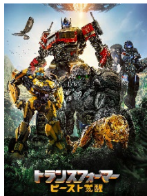
『トランスフォーマー／ビースト覚醒』