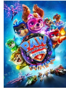
『パウ・パトロール ザ・マイティ・ムービー』