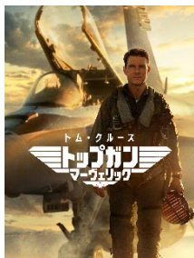
『トップガン マーヴェリック』