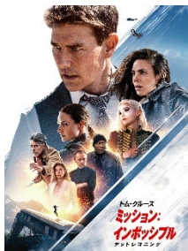
『ミッション：インポッシブル／デッドレコニング』