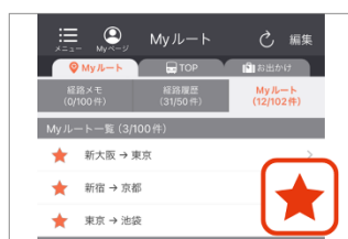
▲ よく使う駅・経路の入力がカンタンに