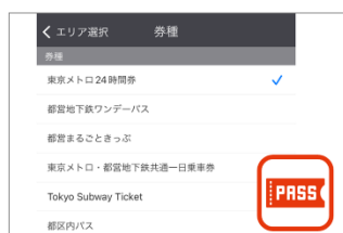
▲ 100券種以上のフリーパスエリア内検索