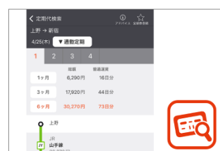
▲ 定期代検索とのりこし精算