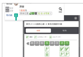
▲ 号車単位でわかる詳細な乗車位置表示