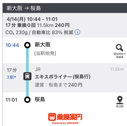
▲ 新大阪～桜島直通「エキスポライナー」の運転開始