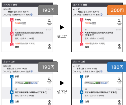
▲ JRなどで運賃改定実施。値下げ区間も