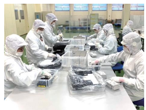
【関東工場 フルフィルメントサービス 作業風景】