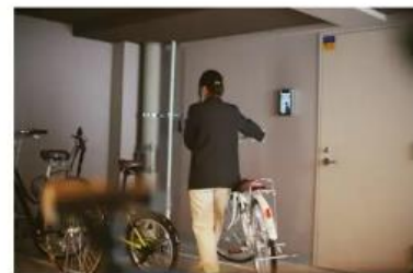
※今回導入物件とは異なるイメージ画像