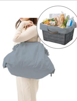
パタント クーラー レジカゴ用バッグ