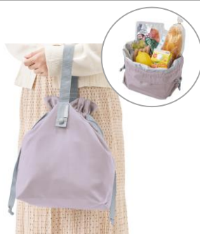
クルリトコンパクト クーラー巾着バッグ