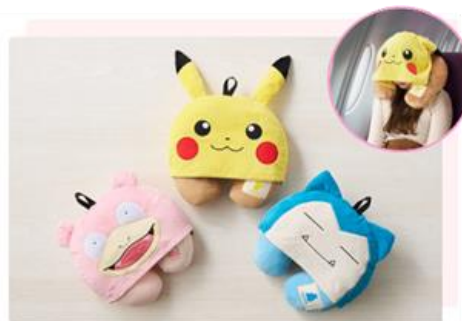
フード付きネックピロー