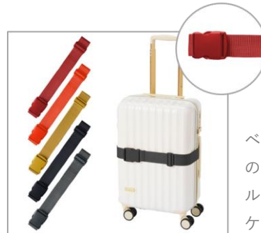
gowell スーツケースベルト

シンプルデザインと優しい色使いが特徴！TS ダイアルロックが付いたスーツケースベルト。