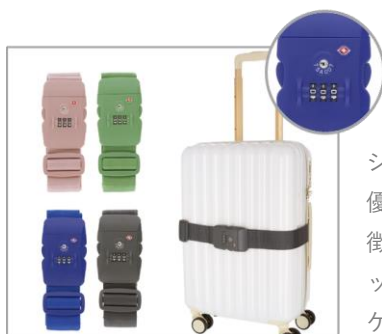
TS ロック付のスーツケースベルト

シンプルデザインと優しい色使いが特徴！TS ダイアルロックが付いたスーツケースベルト。