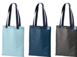
ショルダーバッグ