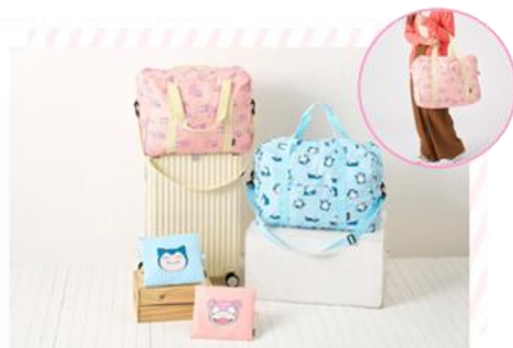
ポーチにしまえるキャリーオンバッグ