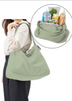
クルリトコンパクト クーラーショルダーバッグ