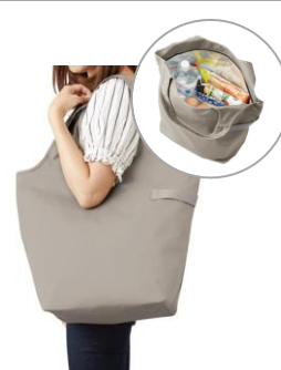
クルリトクーラー マルシェバッグ