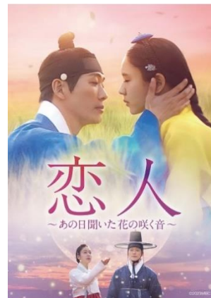
「恋人 ～あの日聞いた花の咲く音～」