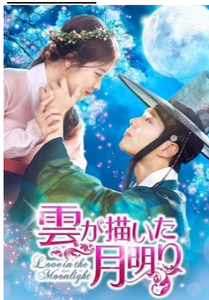
「雲が描いた月明り」