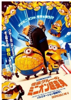
「怪盗グルーのミニオン超変身」