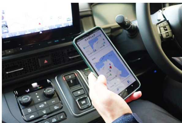
▲ライドシェアの車内でドライバー用アプリを操作する様子

利用者予約システム、運行管理/予約管理システム、ドライバー用アプリ、IoT 車載デバイスなどライドシェアの運営に必要な機能を一括で提供。運行管理者、ドライバーならびに乗客の利便性に配慮した設計となっています。乗客は利用者予約システムから日時と出発地点、到着地点を指定し、乗車予約を行います。運賃は定額制と距離制を選択することが可能で、予約時に支払いを済ませます。ライドシェアで使用する車両には IoT 車載デバイスを搭載しており、デバイスから取得したデータはリアルタイムで運行管理/予約管理システムに蓄積されます。運行管理者は運行管理/予約管理システムで GPS の緯度・経度情報から車両の走行ルートを確認したり、法定外の実車状態での長時間の停車などを把握できるため、ライドシェアの利用において不安視される安全性の確保に役立ちます。ドライバーは専用のアプリで出発地点と到着地点を確認して乗客を迎えに行きます。アプリには初めて運行業務を行う方にもわかりやすい業務ナビゲーションが搭載されており、実車・降車などのステータス変更や、運賃計算等の機能が含まれています。これにより一般ドライバーでも安心して運行業務を行うことができます。