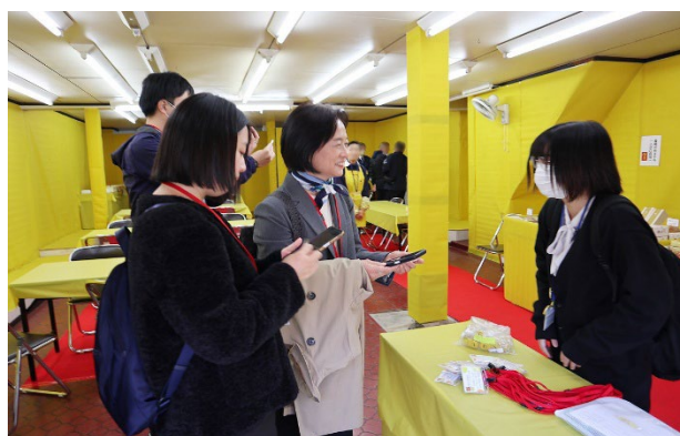
▲12月7日(土)からスタートした平戸観光協会主催のイベント「カステラ イエロー イマーシブ」でカステラバイキングを楽しみました。

Will Smart は平戸市での実証運行を通じて得られたフィードバックをもとにさらなるサービスの改善を図り、新たな交通手段の選択肢の一つとして公共ライドシェアを確立したいと考えています。今後も地域の皆様と協力しながら、交通空白地の解消に向けた取り組みを進めてまいります。