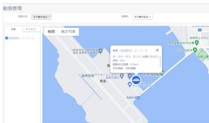
▲動態管理画面のイメージ