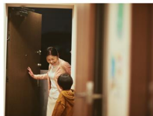
▲ 友人なども“顔ダケで” ※アプリで招待