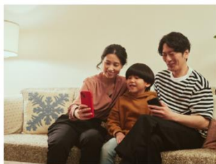
▲ アプリから1度だけ顔登録