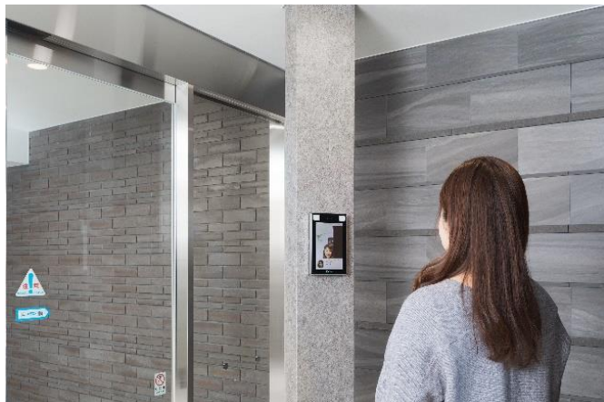
導入イメージ（エントランス）

設置することで、「FreeiD」が本計画の利便性を高め、入居者にとってより一層快適な日常生活を叶える一助となるものと評価し導入を決定いたしました。「FreeiD」導入により、住宅の入居者及びスモールオフィスのテナントが物理的な鍵から解放され、顔認証だけで全てのセキュリティを通過できるものとなります。