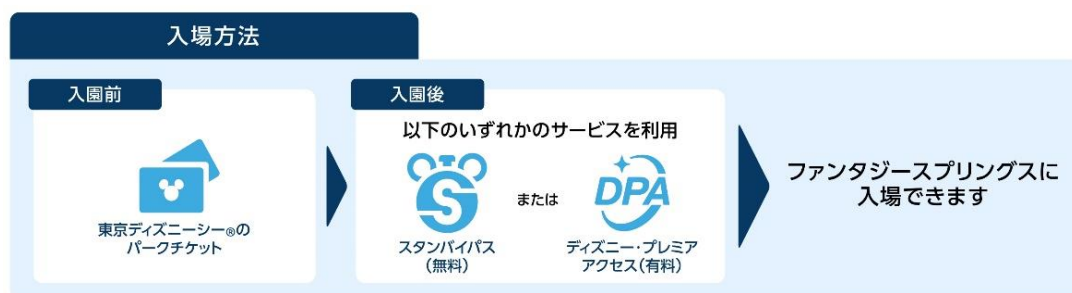
「ファンタジースプリングス」 ご体験に必要なチケットとサービス

なお、「ファンタジースプリングス」へのご入場および「ファンタジースプリングス」内の対象アトラクションのご利用には、東京ディズニーシーのパークチケットの他に、対象アトラクションの「スタンバイパス」（無料）または「ディズニー・プレミアアクセス」（有料）の取得が必要です。