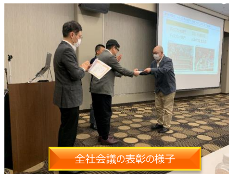
全社会議の表彰の様子

当期の目標達成のために全社一丸となるべく、コロナ禍で中断していた全社会議を3月に3年半ぶりに開催しました。会場に集った店長を中心に160名以上が参加し、当期の主要な実施事項を伝達し、メーカー様にもお越しいただいて新規商品のご案内をいただき、最後に前期の表彰(←)を店長に行き散会しました。今期の目標を達成すべく全社員一丸で尽力します。