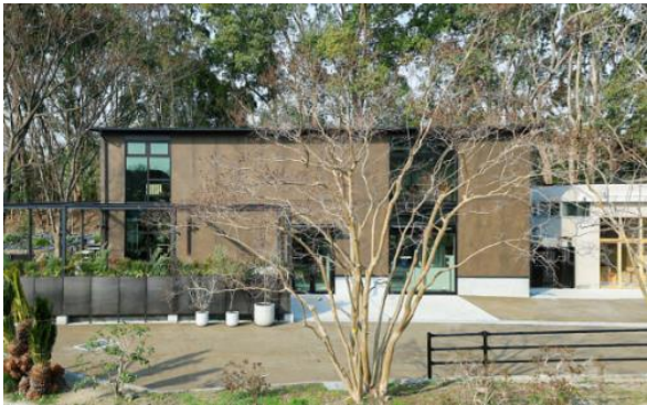
「100ORE SCENES(センリシーンズ)」外観

※本案件は、大阪府豊中市も14日付で発表していますのでそちらのリリースも参考資料として添付しております。