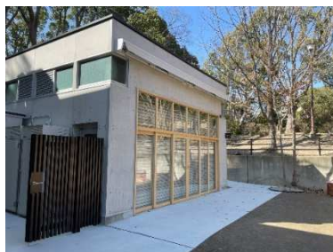
コミュニティスペース外観写真