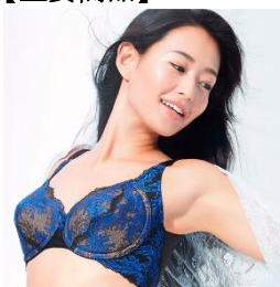
カーヴィシヤス シリーズ