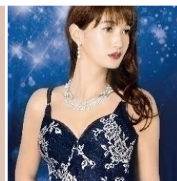
デコルテ リュミエス シリーズ