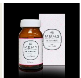
健康食品及びサプリメント