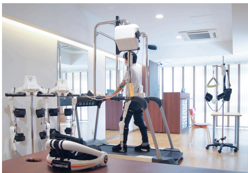
ロボケアセンター（イメージ）

また、全てのロボケアセンターにおける Neuro HALFIT に対して、一部の民間保険(*2)や当社の株主優待制度(*3)がご利用いただけます。ご利用条件がありますので、詳細については脚注に記載されている文書をご確認ください。