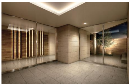
【(下) エントランスイメージ】