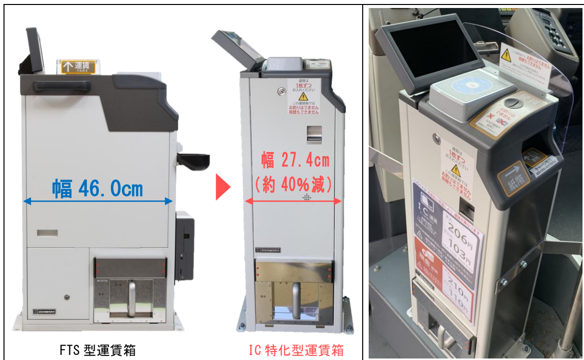
▲IC特化型運賃箱のサイズ比較