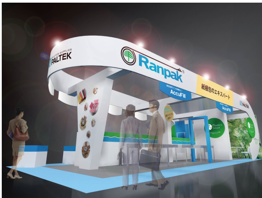
「第7回通販ソリューション展 春」ブースイメージ

「第7回通販ソリューション展 春」では、大量梱包ライン向けすき間埋め自動梱包システム「AccuFill®(アキュフィル)」の実演のほか、各物流ニーズにあわせた梱包システムを展示します。