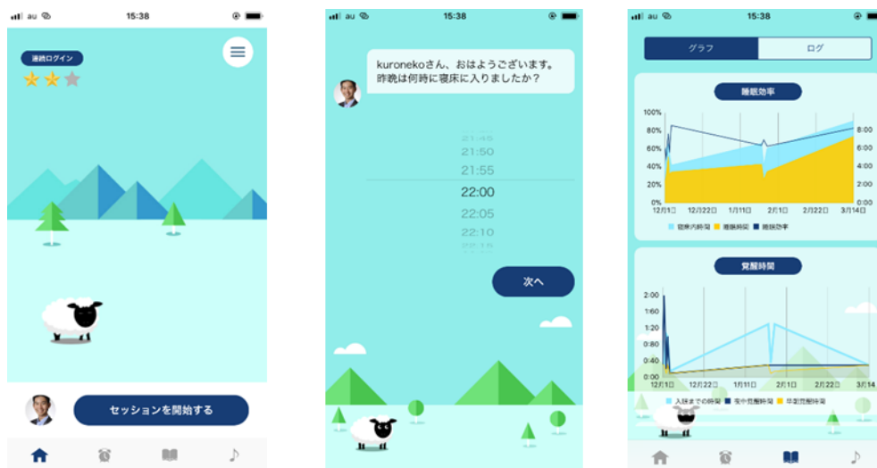
(アプリの画面イメージ)

当社は、この睡眠問題解消アプリの販売を皮切りに、従業員向けのソリューションの開発を強化してまいります。