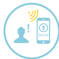
スマホアプリへ異常を通知