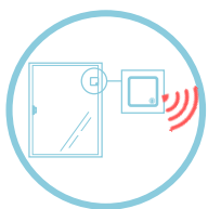
センサーが振動を感知し、無線でゲートウェイに伝達