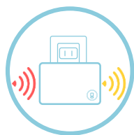
異常を受信無線LANからスマホアプリへ