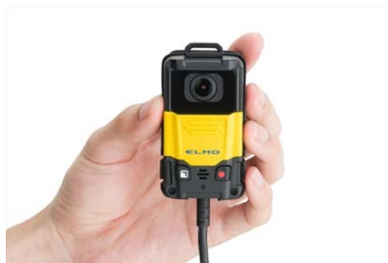
EW-1 本体価格：オープン価格

エルモ社では、小型カメラとして平成18年にSUV-Cam、平成25年にQBiC-S、平成26年にQBiC MS-1をリリースし、セキュリティ用途からアクションカメラ用途まで幅広い小型カメラの開発・製造・販売を行ってまいりました。また一方で「カメラとスマホのホームセキュリティ」としてクラウド型カメラを発売し、IoT市場にも平成27年から携わってまいりました。