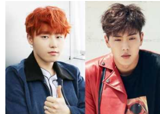
「Power of K」MC ユグオン(Block.B)、シヨヌ(MONSTA X)

「Kchan! 韓流 TV」では、K-POPアイドル中心の番組に力を入れ、オリジナル番組も充実! ソウル収録の新音楽番組「Power of K」や平日のレギュラー番組として、ジュノ&ギュミン(from BEE SHUFFLE)出演「JGのハルハル TV」を月~金でベルト編成するほか、今後ブレイク必至のアイドルたちの密着独占番組などをお届けする予定です。