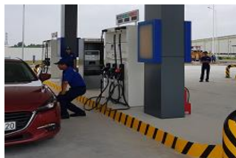
接客サービス訓練の様子