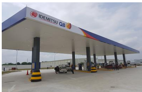
タンロン工業団地SS全景