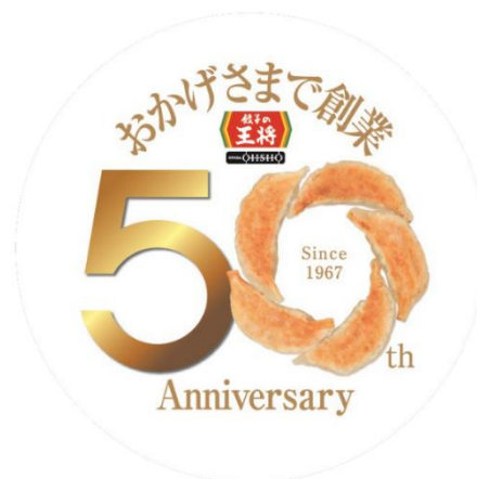
創業50周年ロゴマーク