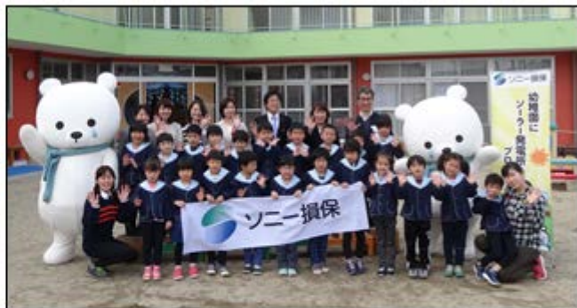
そらべあ発電所寄贈記念式典での集合写真 ※19基目 なわてすみれ園（大阪府四條畷市）