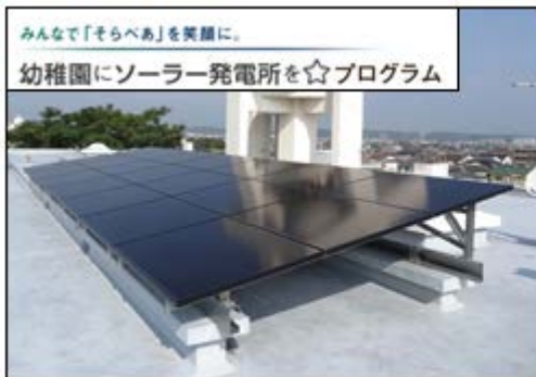
太陽光発電設備「そらべあ発電所」設置イメージ ※14基目 ドンボスコ保育園（宮崎県宮崎市）

ソニー損保は、全国の幼稚園や保育園に太陽光発電設備「そらべあ発電所」を設置するため、2009年3月から、自動車保険の「保険料は走る分だけ」とする商品特性を活かした「幼稚園にソーラー発電所を☆プログラム」(*2) を運営し、そらべあ基金に寄付を行ってきました。同プログラムによるソニー損保からの「そらべあ発電所」の寄贈数は、同園への寄贈で合計 20 基となります。