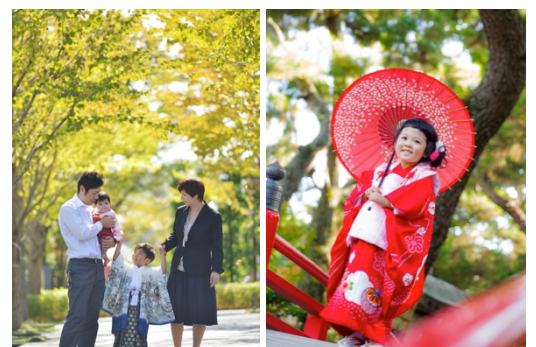
自然体でいきいき・自分らしい

※インターネットアンケート 期間:2016年1月29日~1月31日 回答者数:1136名