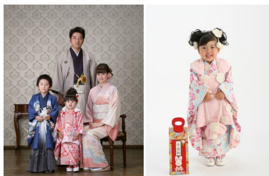
かしくまった感じ…