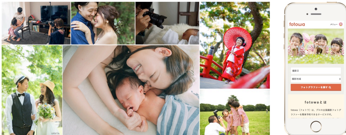
▲出張撮影「fotowa」の撮影例、及び撮影風景

ピクスタ株式会社が運営する、写真を見て好みの作風のフォトグラファーに出張撮影を依頼できる「fotowa(フォトワ)」( https://fotowa.com/ )が、2017年6月8日より、九州初となる福岡県でサービスを開始します。