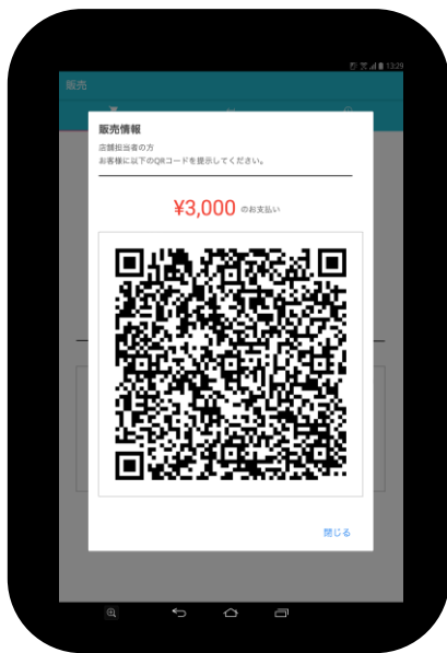
【店舗タブレット】 商品情報のQRコード表示