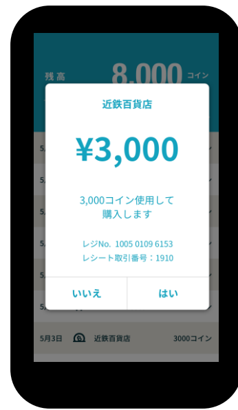
【お客様のスマートフォン】 QRコードを読み取った後の画面