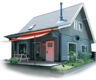
カントリーログハウス