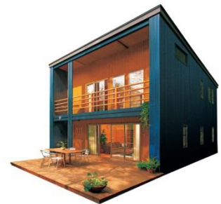
ワンダーデバイス