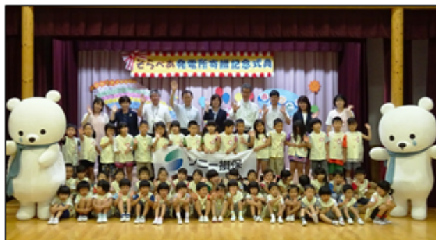
そらべあ発電所寄贈記念式典での集合写真