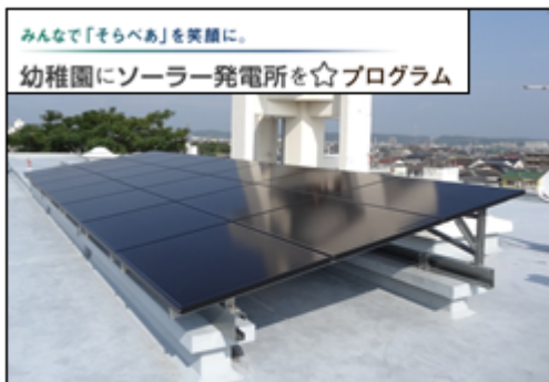
太陽光発電設備「そらべあ発電所」 設置イメージ

ソニー損保は、全国の幼稚園や保育園に太陽光発電設備「そらべあ発電所」を設置するため、2009年3月から、自動車保険の「保険料は走る分だけ」とする商品特性を活かした「幼稚園にソーラー発電所を☆プログラム」(*2) を運営し、そらべあ基金に寄付を行ってきました。同プログラムによるソニー損保からの「そらべあ発電所」の寄贈数は、同園への寄贈で合計 19 基となります。