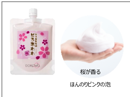
桜が香る ほんのりピンクの泡

春の肌は、肌リズムの乱れや血行不良により角質が厚くなってくすみがち。さらに花粉による刺激や、急激に強くなる紫外線ダメージにより、いっそう不安定でゆらぎやすくなっています。今回、そんなくすみ肌をクリアに洗い上げる「どろあわわ<桜>」を新発売。「桜の花エキス」 *1 、「キイチゴ果汁」 *1 、「保湿型ビタミン C 誘導体」 *2 、「加水分解ヒアルロン酸」 *1 、「加水分解ローヤルゼリータンパク」 *1 、「はちみつ」 *1 を加え、うるおいを与えながら透明感とハリにみちたクリアな肌へ導きます。ほんのりピンク色のもっちり濃密泡は、咲きたての桜の香り。心も華やくような洗顔タイムをお楽しみいただけます。