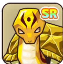
【強化・売却用】ゴールドタートルスネーク【SR】x 3 体

【事前登録サイト】 https://www.andapp.jp/apps/5737897193897984?from=top_listing