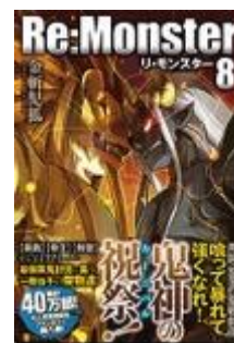
Re:Monster 8巻 (2016年8月刊行)