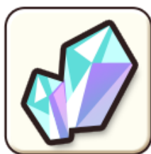
精霊石 x 130 個

AndApp プラットフォームからリリース開始までに事前登録されたプレイヤー様には、以下の特典をプレゼント致します！