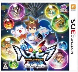
『パズドラクロス 神の章』 パッケージ画像