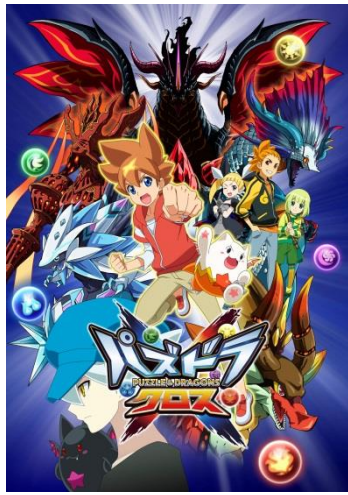
TVアニメ『パズドラクロス』 メインビジュアル