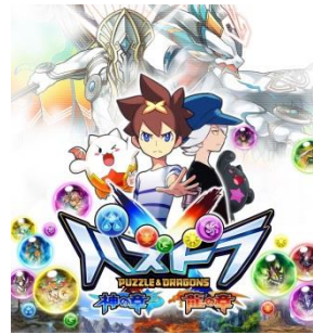
イメージビジュアル