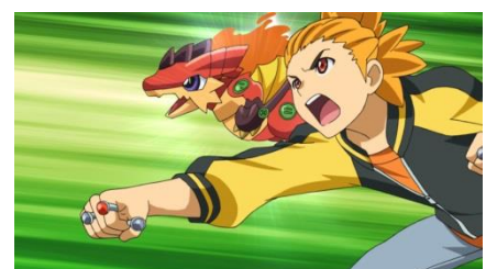
新しい旅の仲間、タイガー