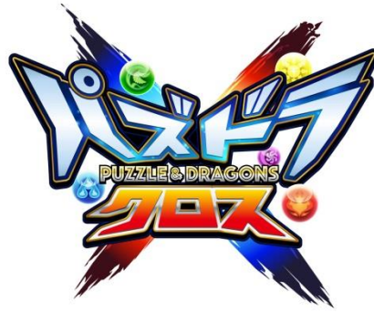
TVアニメ『パズドラクロス』 ロゴ