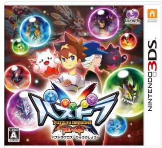
『パズドラクロス 龍の章』 パッケージ画像