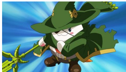
覚醒オーデインの力で戦うタマゾー