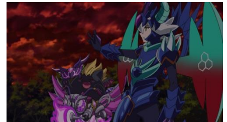
相棒のデビと共に戦うランス