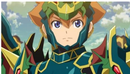
ソウルアーマーを装備したエース