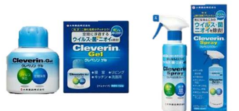
クレベリン ゲル クレベリン スプレー