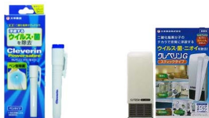
クレベリン パワーセイバー クレベリンG スティックタイプ