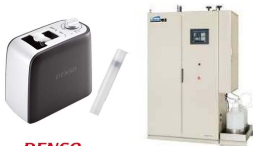
DENSO 車両用クレベリン クレベリン発生機 リスパス NEO