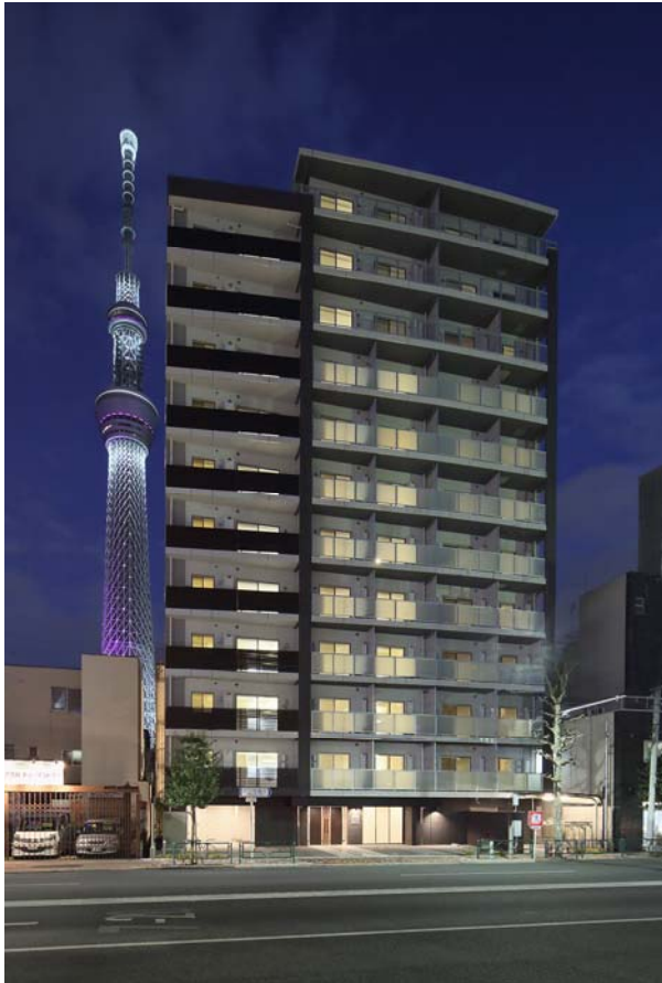
物件3：パークアクセス押上・隅田公園