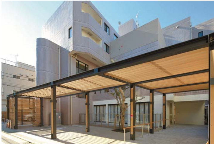
物件4：メディカルホームグランダ三軒茶屋（底地）