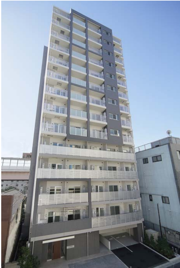
物件2：パークアクセス錦糸町レジデンス