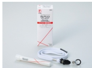
(新製品) クレベリン パワーセイバー