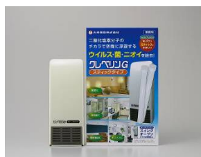
クレベリンG スティックタイプ