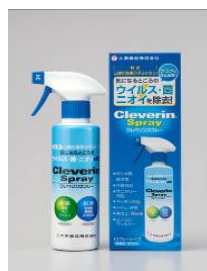
クレベリンスプレー