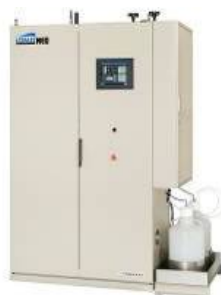
クレベリン発生機 リスパス NEO