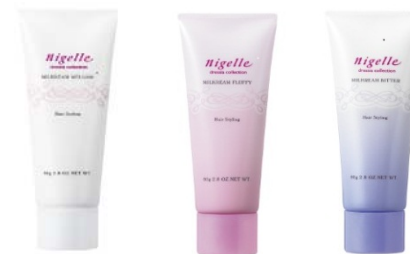
<ミルククリームシリーズ>