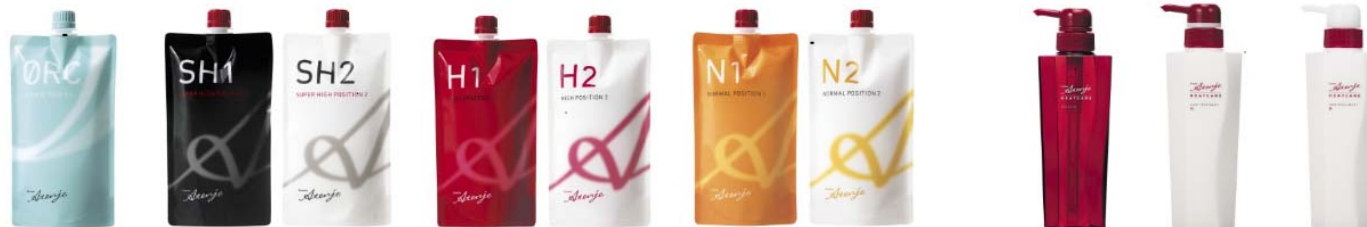
<リシオアテンジェ ストレート剤シリーズ>