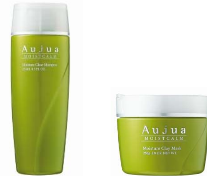
<モイストカームライン>