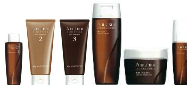
<タイムサージライン>