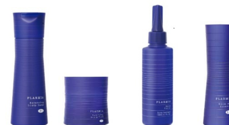
<プラーミア 新アイテム>